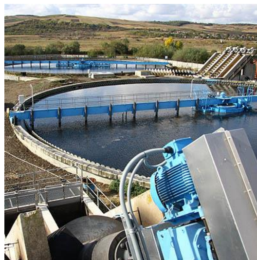
STATIA DE EPURARE \